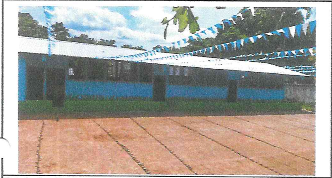
Foto1: Sustitución de lamina por lamina troquelada galvanizada