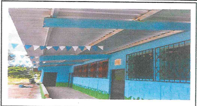
Foto 2: sustitución de soporte metalico por costaneras de metal galvanizado