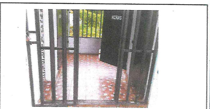
Foto 6: sustitucion de piso de cemento a piso ceramico en los baños

Observación: Si es necesario se pueden agregar hojas adicionales y actualizar el número de fotos.